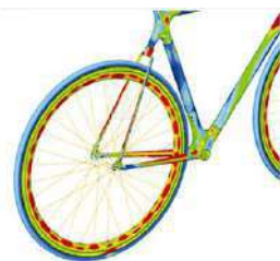
自転車のフレームにかかる応力を計算する (構造解析)