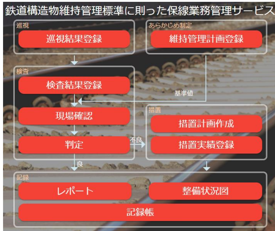
クラウドベースに標準化した保線管理システム

鉄道線路の維持管理に携わる方々の業務を支援するシステム (線路、機械等のメンテナンス業務を支援するシステム) の 開発・販売