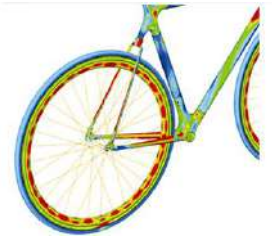
自転車のフレームにかかる応力を計算する (構造解析)