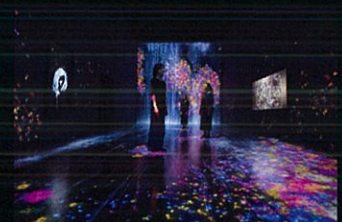
Future World: Where Art Meets Science