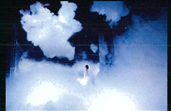
teamLab Massless Beijing