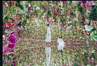
teamLab Planets TOKYO DMM