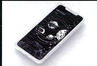
BUMP OF CHICKEN リスナー向け公式アプリ