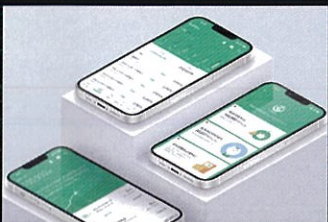
りそなグループアプリ