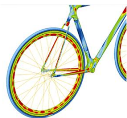
自転車のフレームにかかる応力を計算する (構造解析)