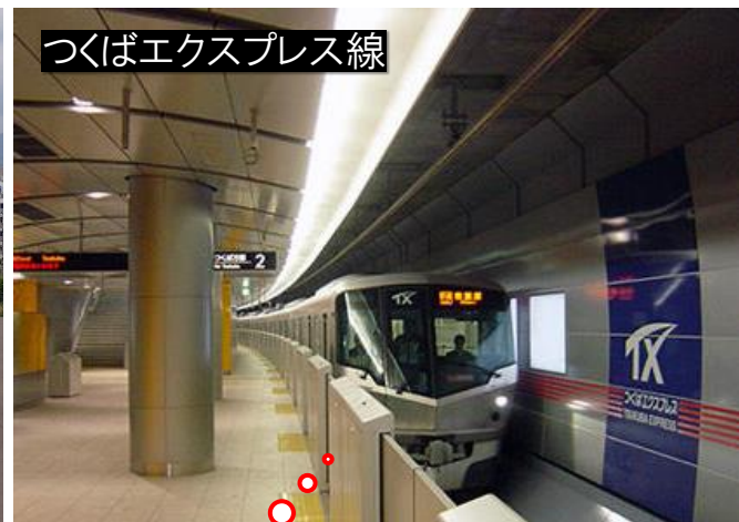
つくばエクスプレス線