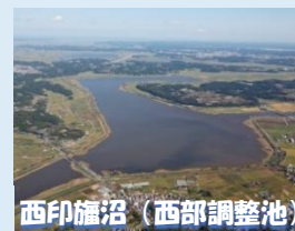
西印旛沼(西部調整池)